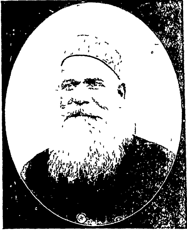
रायवहादुर बाबू जालिमसिंह